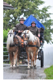
Egal wie das Wetter war!