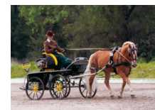
Bayerische Landesturnier in Gunzenhausen 2011

Vielen Dank an alle Beteiligte für das schöne und gelungene Event.