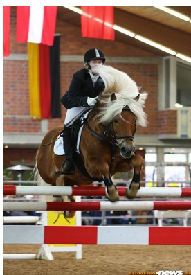
JHV & Hengstpräsentation 2011 Der IG Edelbluthaflinger e.V.

Die 3. Jahreshauptversammlung der IG Edelbluthaflinger e.V. am 04. Februar 2011 in Alsfeld